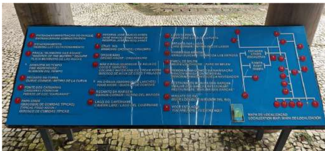
Placa Indicativa braile – 198 x 70 cm