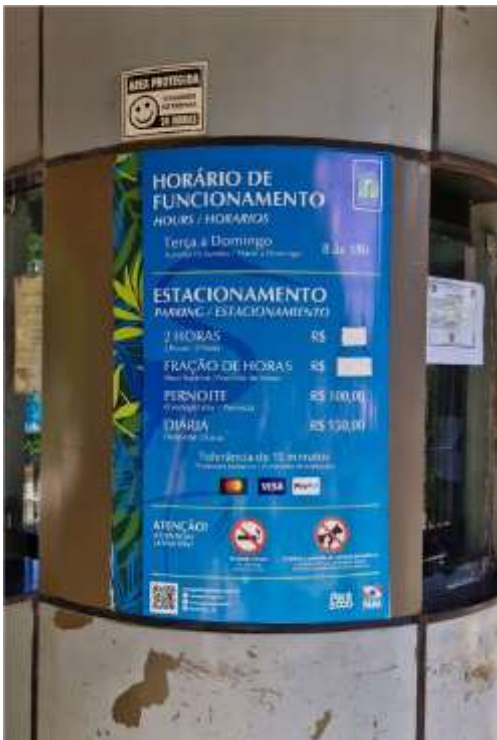
Placa Informativa - 63 x 100 cm