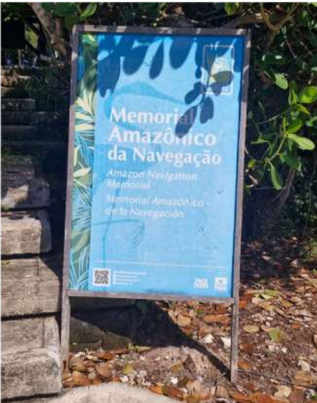
Placa Informativa – 74 x 110 cm