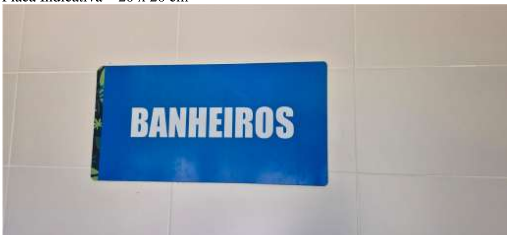
Placa Indicativa – 80 x 40 cm