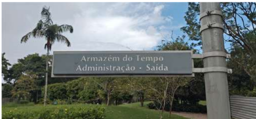
Placa Indicativa – 80 x 15 cm