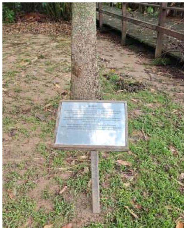
Placa Informativa “Espécies de planta” – 26 x 17 cm