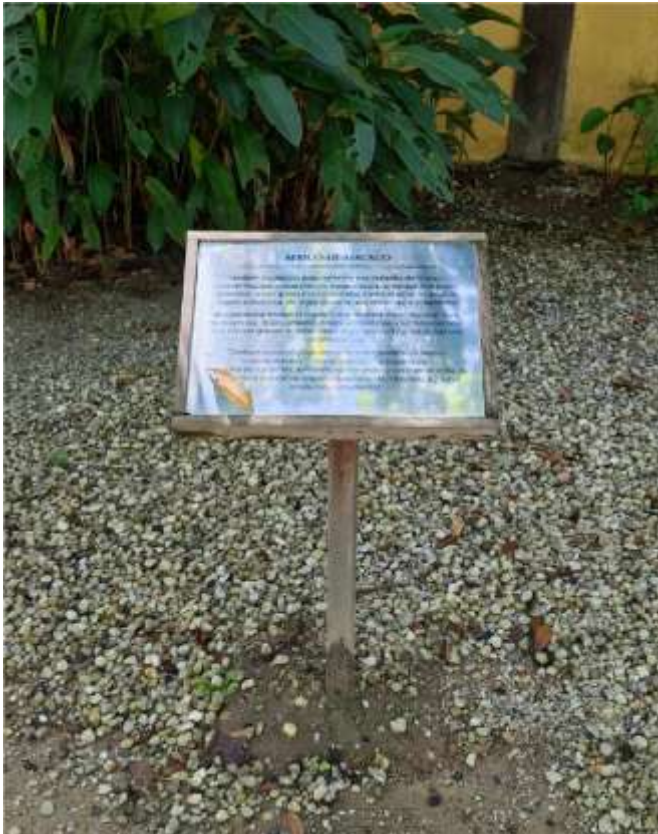
Placa Informativa - 42 x 30 cm