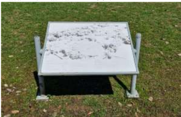
Placa Informativa - 97 x 76 cm