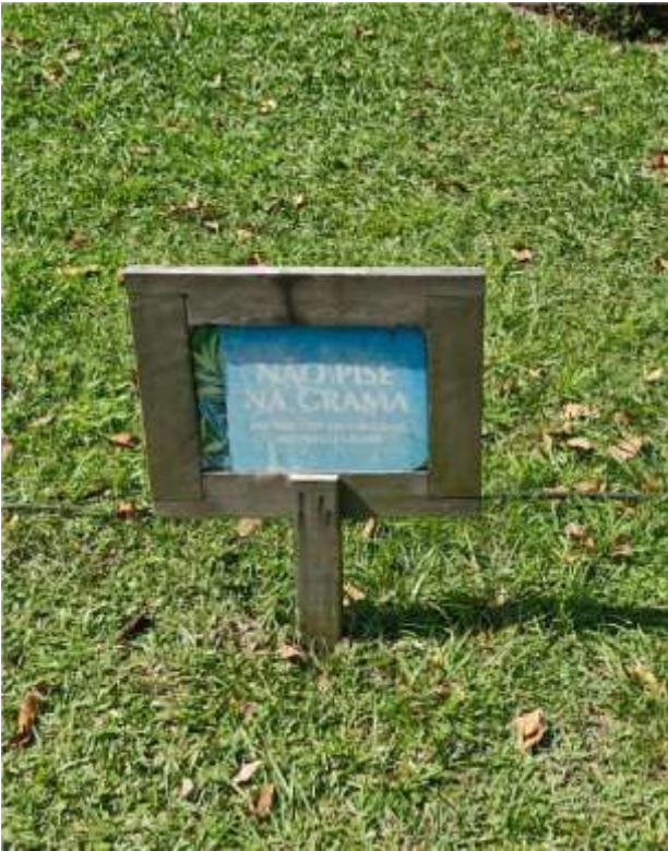
Placa Informativa – 25 x 18 cm