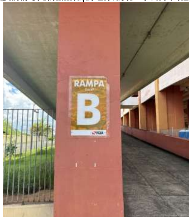
Placas de Identificação Rampa A/B – 54 x 90 cm