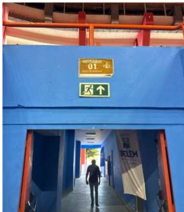
Placas de Identificação Vestiário 1 e 2 – 39 x 20 cm