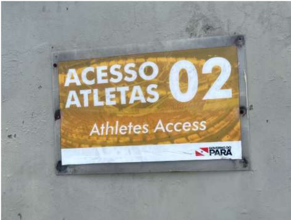
Placas de Identificação Acesso Atletas – 90 x 53 cm