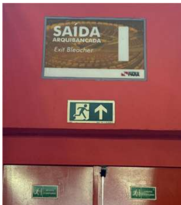
Placas de Identificação Saída de Emergência A a M - 93 x 53 cm