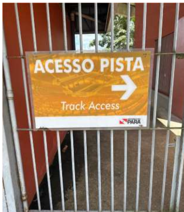
Placas de Identificação Acesso Pista Cadeira B – 94 x 60 cm