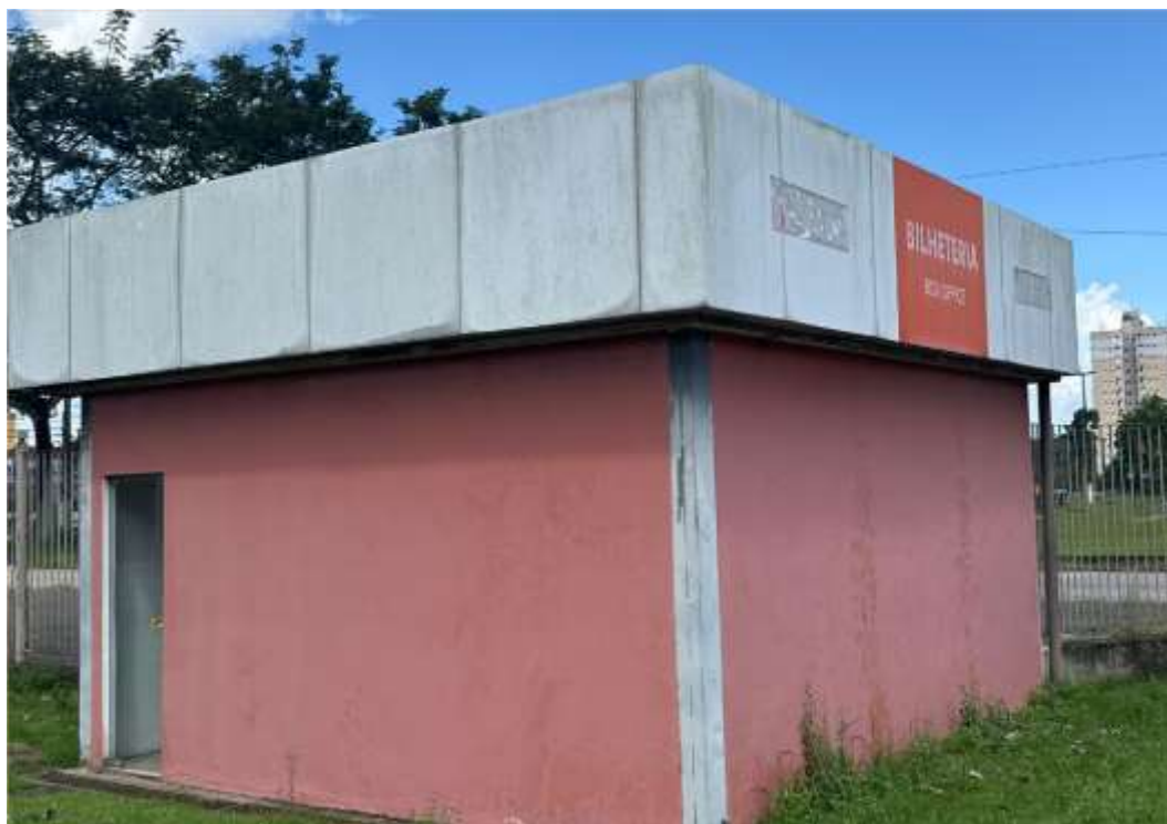
Fachadas Bilheteria A e B – 6 x 1,20 m